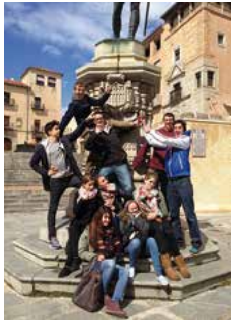
Vor dem Palacio Real

Unseren ersten Morgen in Spaniens Metropole starteten wir in sehr spanischer Manier und genossen ein spätes Frühstück in jener Bar gleich beim Hotel, die fortan unsere Stammbar werden sollte: Churros con chocolate wurden zur Standardmahlzeit. Am Mittag besuchten wir den Palacio Real, der sehr imposant ausgestattet ist und mit prächtigen Sälen aufwarten kann. Den Rundgang beschlossen wir mit einem kurzen Abstecher in die königliche Waffenkammer.