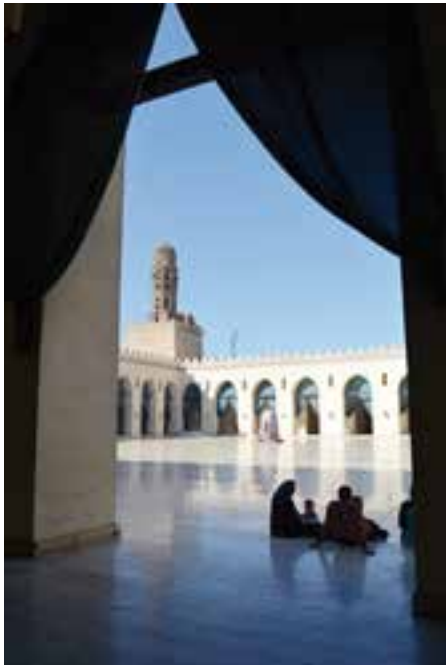
Moschee von Al-Hakim (985-1021) am Rande der Altstadt Kairos.

Nachdem wir uns im Hotel eingerichtet hatten, unternahmen wir bereits am ersten Abend einen Fussmarsch durch die nähere Umgebung. Am Montag machten wir eine Stadtbesichtigung von unserem Hotel aus, über den Tahirplatz, durch das koloniale Zentrum in die Kairoer Altstadt. Dort haben wir uns dann zum ersten Mal verlaufen. Wir landeten inmitten von Hinterhöfen und Werkstätten und wussten nicht, wie weiter. Dank der Hilfsbereitschaft von Einheimischen fanden wir den Weg wieder und konnten anschliessend die Al-Hakim-Moschee besichtigen. Am Abend besuchten wir ein Café, das im Laufe der Woche zu unserem Stammcafé wurde.