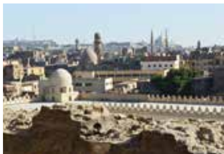
Blick von der Ibn Tulun-Moschee (879) auf die Zitadelle mit der Muhammad Ali-Moschee (1884).

Schweizer Botschaft. Bei diesen Begegnungen erfuhren wir vieles über das Leben und Arbeiten in Kairo und bekamen wichtige Hintergründe zur aktuellen politischen Lage.